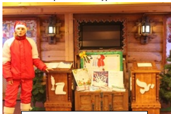
Гномик привел нас на почту