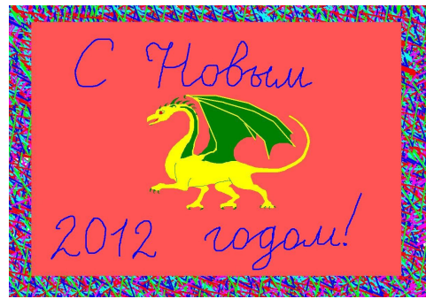
Рисунок выполнен Луцкой А. 9 «Г» класс

История Нового Года насчитывает около 25 веков. По мнению ученых, обычай этот впервые родился в Месопотамии, где в конце IV тысячелетия до нашей эры родилась цивилизация. Древние народы праздновали Новый Год в марте. Именно в марте начинались полевые работы, и древние римляне считали март первым месяцем года. Только в 46 году до н.э. римский император