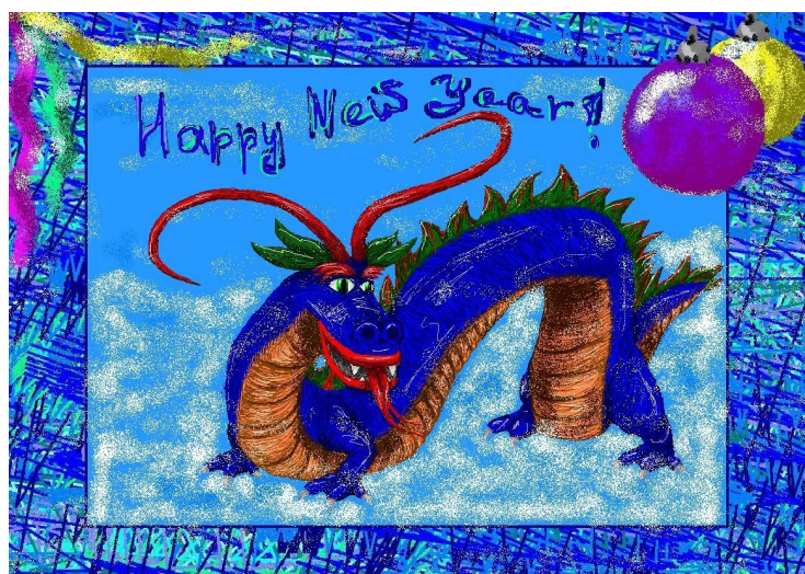
Рисунок выполнен Осиповой И. 10 класс

Новый Год – один из самых любимых праздников в нашей стране. Мы уже, к сожалению, не верим в Деда Мороза, но, несмотря на это, каждый из нас все-таки надеется на чудо, и на то, что наши самые заветные желания сбудутся под звон курантов.