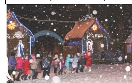
Детский паровозик за подарками